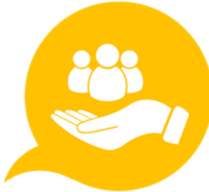
Zorg en Welzijn